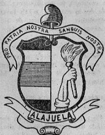
Joya artística de "El Sesteo". Escudo de Alajuela.

Uno de los escudos más bellos que las capitales de provincias ticas ostentan, es sin duda alguna el de la valerosa provincia de Alajuela.